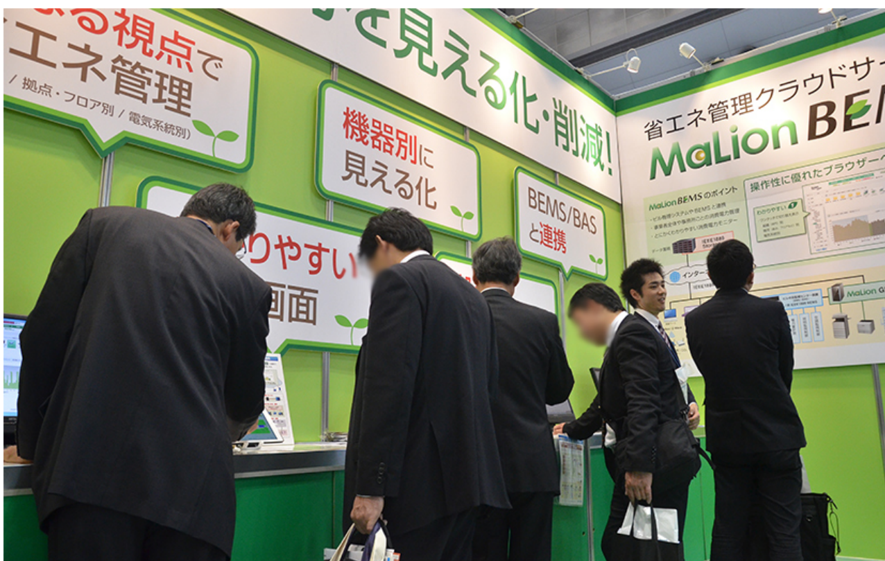
3日間にわたり多くのお客様にお越しいただきました。ありがとうございました。