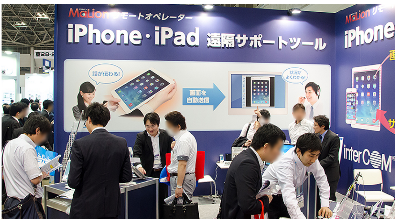
大変多勢のお客様にご来場いただき、操作デモを交えたご説明をお聞きいただきました。