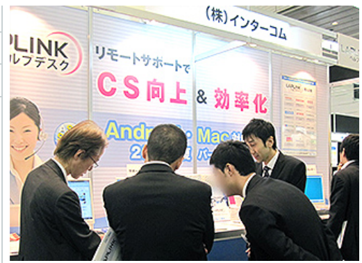
当日は商品に詳しい専任の担当者が同席し、ご説明させていただきます。